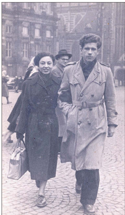
Gerard Reve en zijn toenmalige echtgenote Hanny Michaelis.